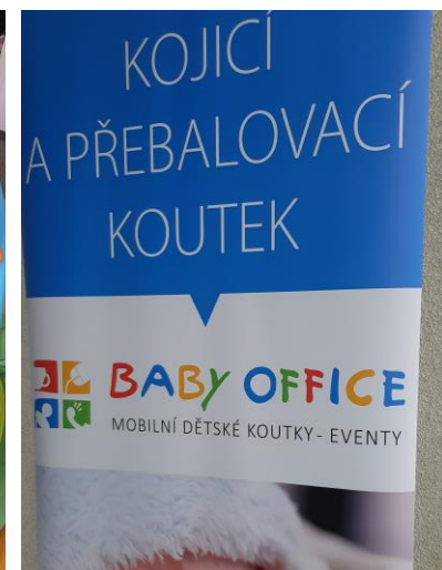
KOJICÍ A PŘEBALOVACÍ ZÓNA